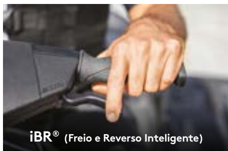
iBR® (Freio e Reverso Inteligente)

Exclusividade Sea-Doo®, o iBR® freia a embarcação em menos tempo e proporciona mais controle e manobrabilidade em ré e baixas velocidades.