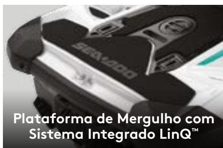
Plataforma de Mergulho com Sistema Integrado LinQ™

Um impressionante espaço de armazenamento de 151,4 L (40 gal.) permite que os passageiros guardem seus pertences com segurança enquanto navegam.