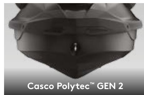
Casco Polytec™ GEN 2

Esta característica exclusiva Sea-Doo® otimiza a entrega de potência, aumentando a economia de combustível em até 46%. 1