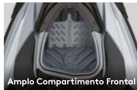
Amplio Compartimento Frontal

O Rotax® 900 ACE™ - 90 proporciona rápida aceleração com economia de combustível impressionante e, para aqueles que desejam desempenho adicional, a potência extra do 1630 ACE™ - 130 é pura diversão e aceleração.